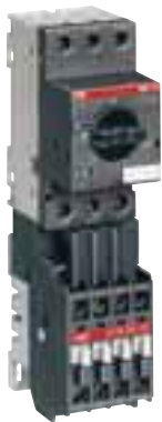
Автоматы для защиты электродвигателей MS 116.. + контактор А 9..+ соединительный блок BEA 16/116