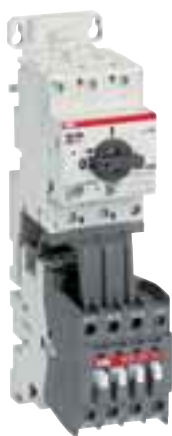
Автоматы для защиты электродвигателей MS 325.. + контактор А 26..+ соединительный блок BEA 26/325